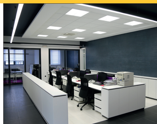
Büro und öffentliche Bereiche